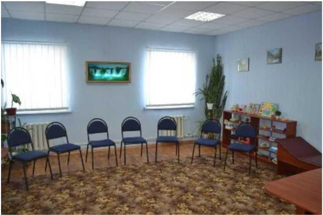
кабінет психолога та соціального педагога