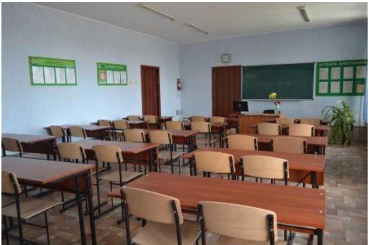
кабінет бухгалтерського обліку