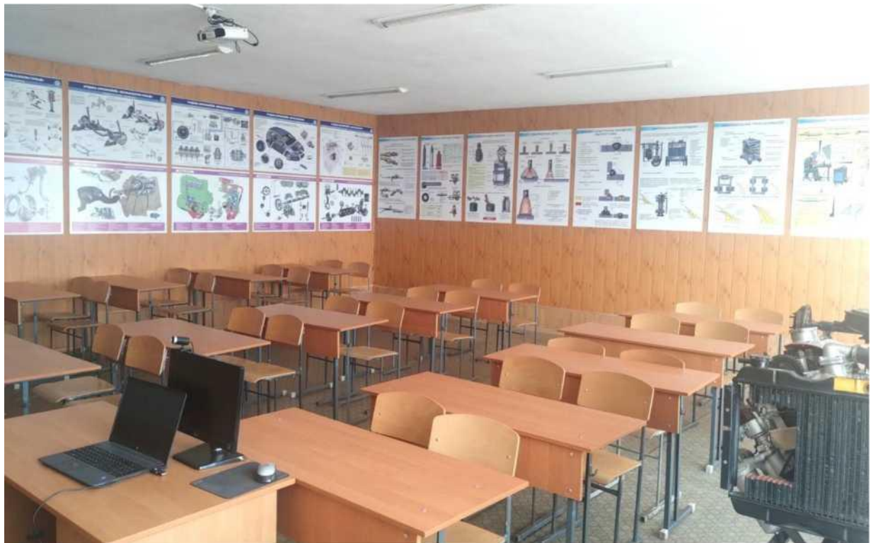
кабінет професійно-теоретичної підготовки з професій "Слюсар з ремонту колісних транспортних засобів», «Електрогазозварник"