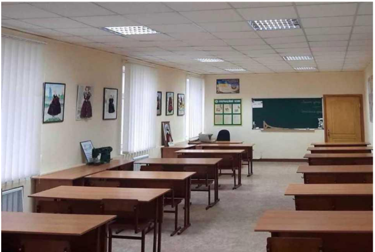
кабінет професійно-теоретичної підготовки за напрямом «Швейне виробництво»