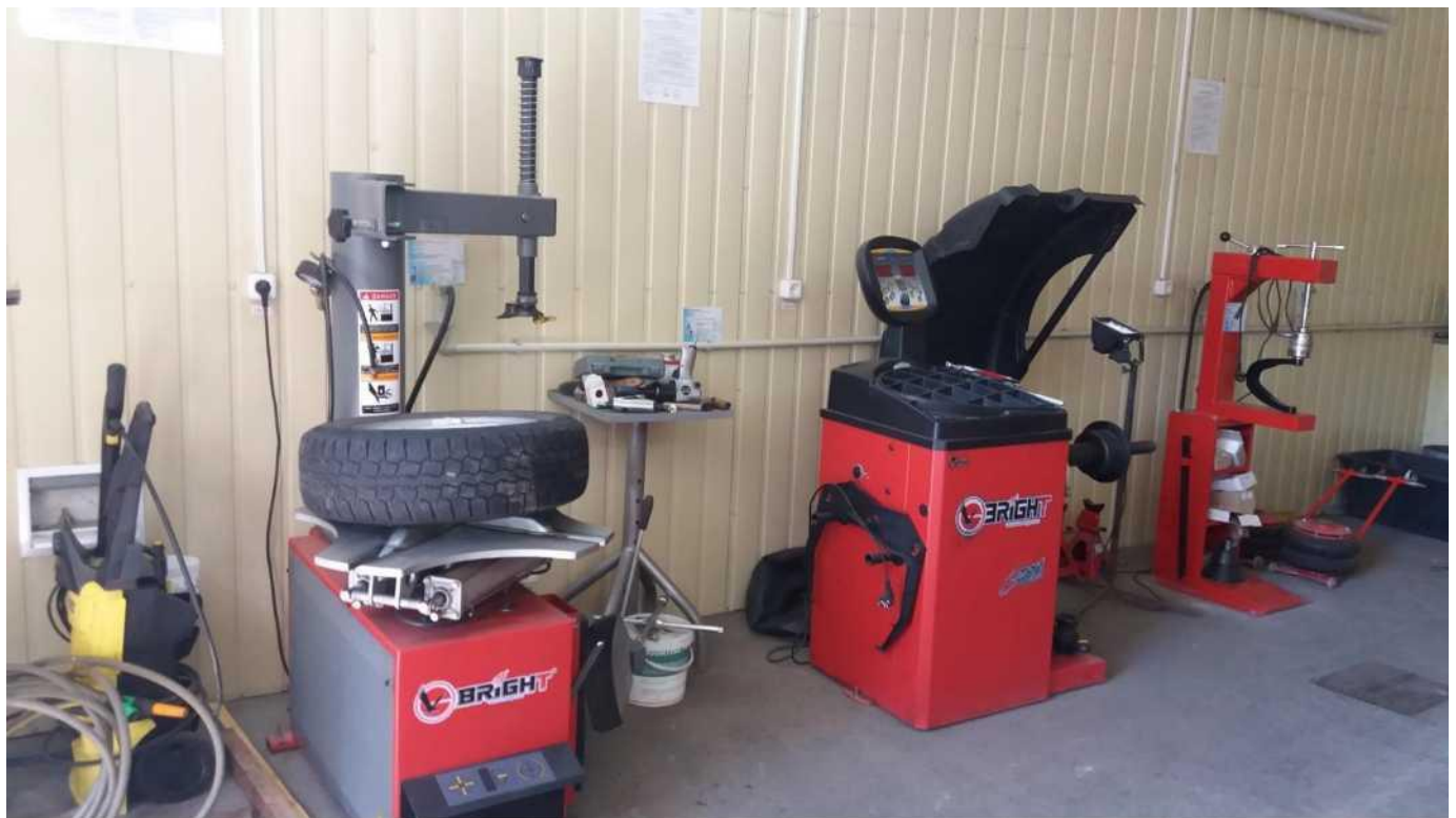
мастерня ремонту колісних транспортних засобів, лабораторія будови колісних транспортних засобів