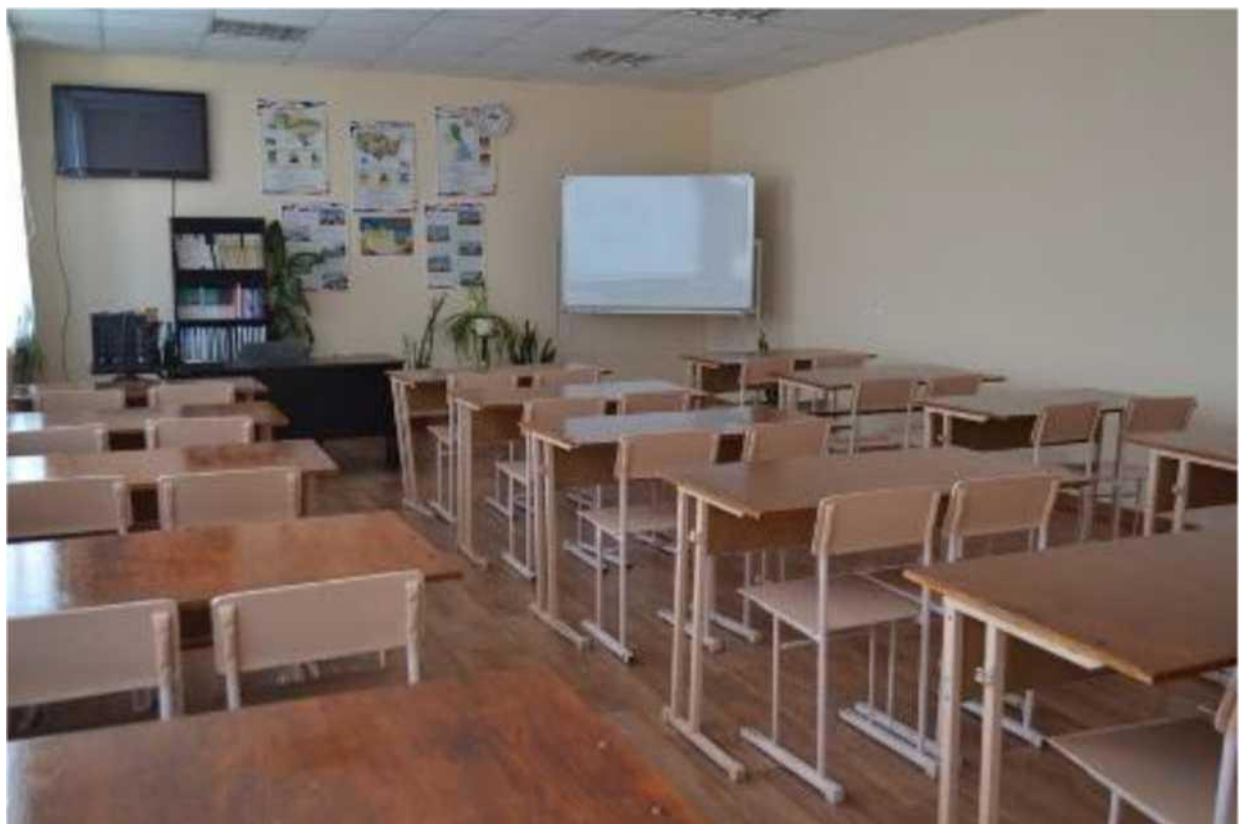
кабінет англійської мови, англійської мови за професійним спрямуванням