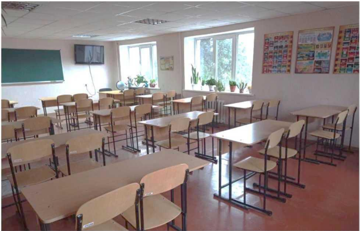
кабінет географії та біології