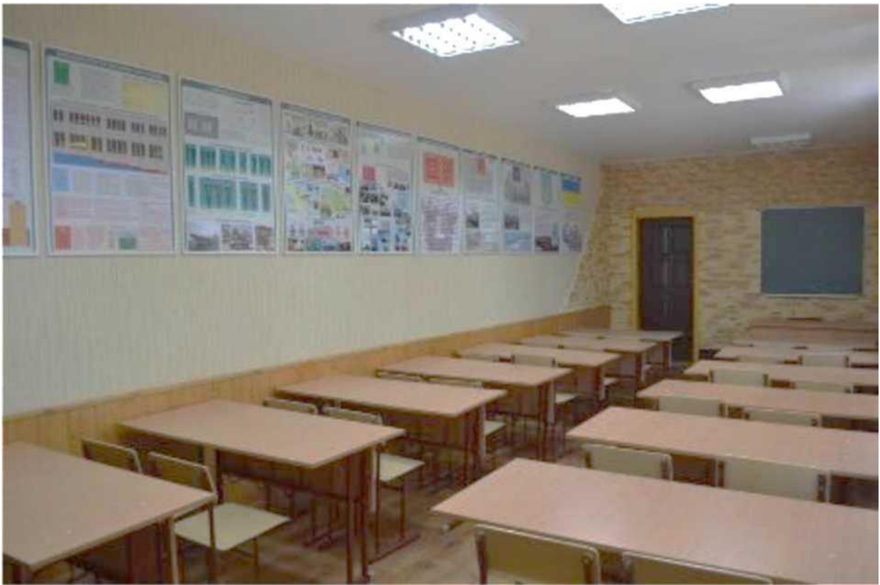
кабінет з предмету "Захист України "