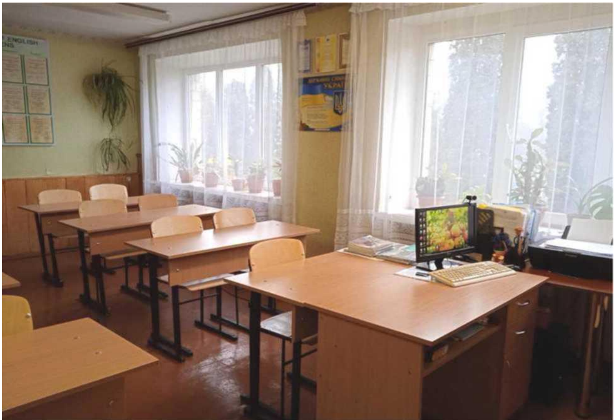
кабінет англійської мови