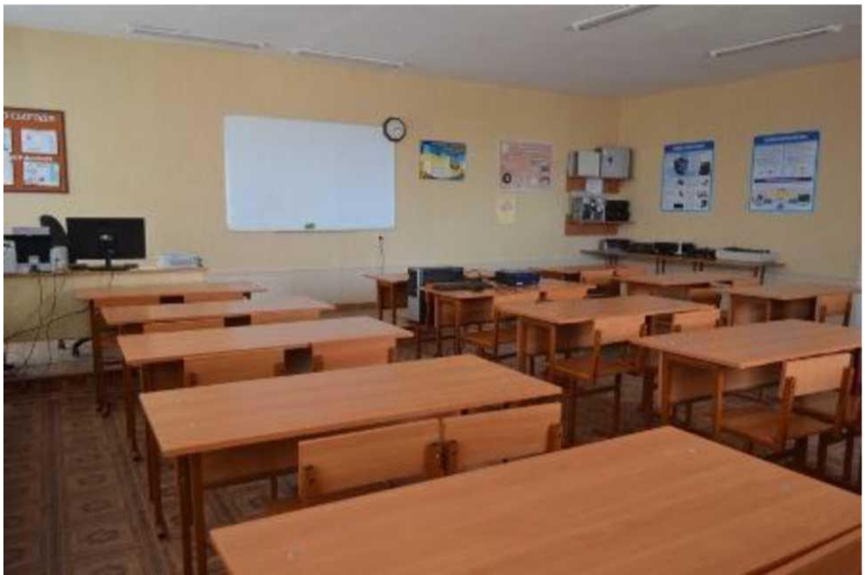
кабінет інформаційно-комунікаційного устаткування та офісної техніки