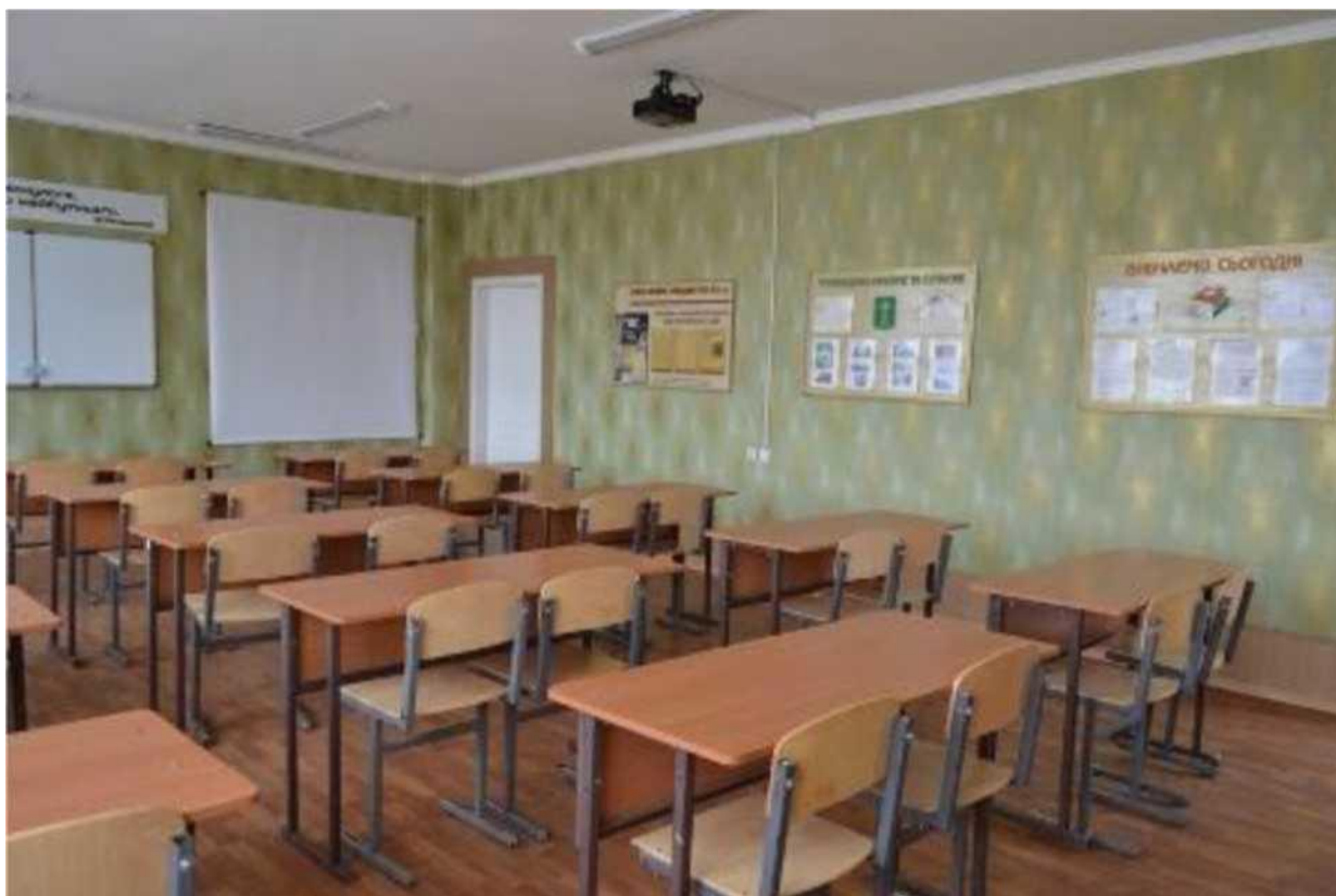
кабінет історії, основ правових знань