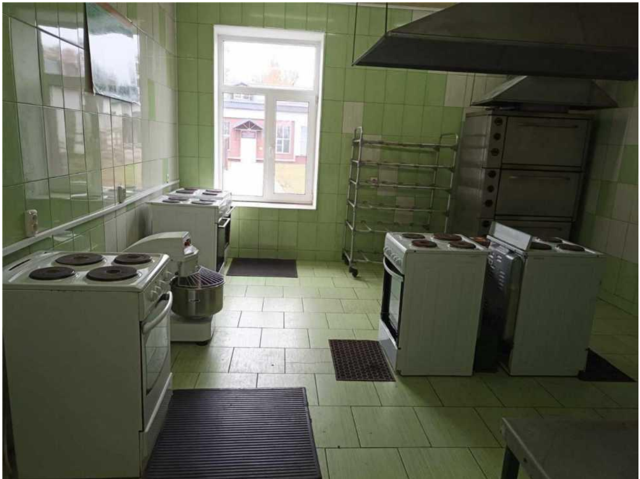
кухня-лабораторія з дегустаційною залою з професії "кухар, кондитер"