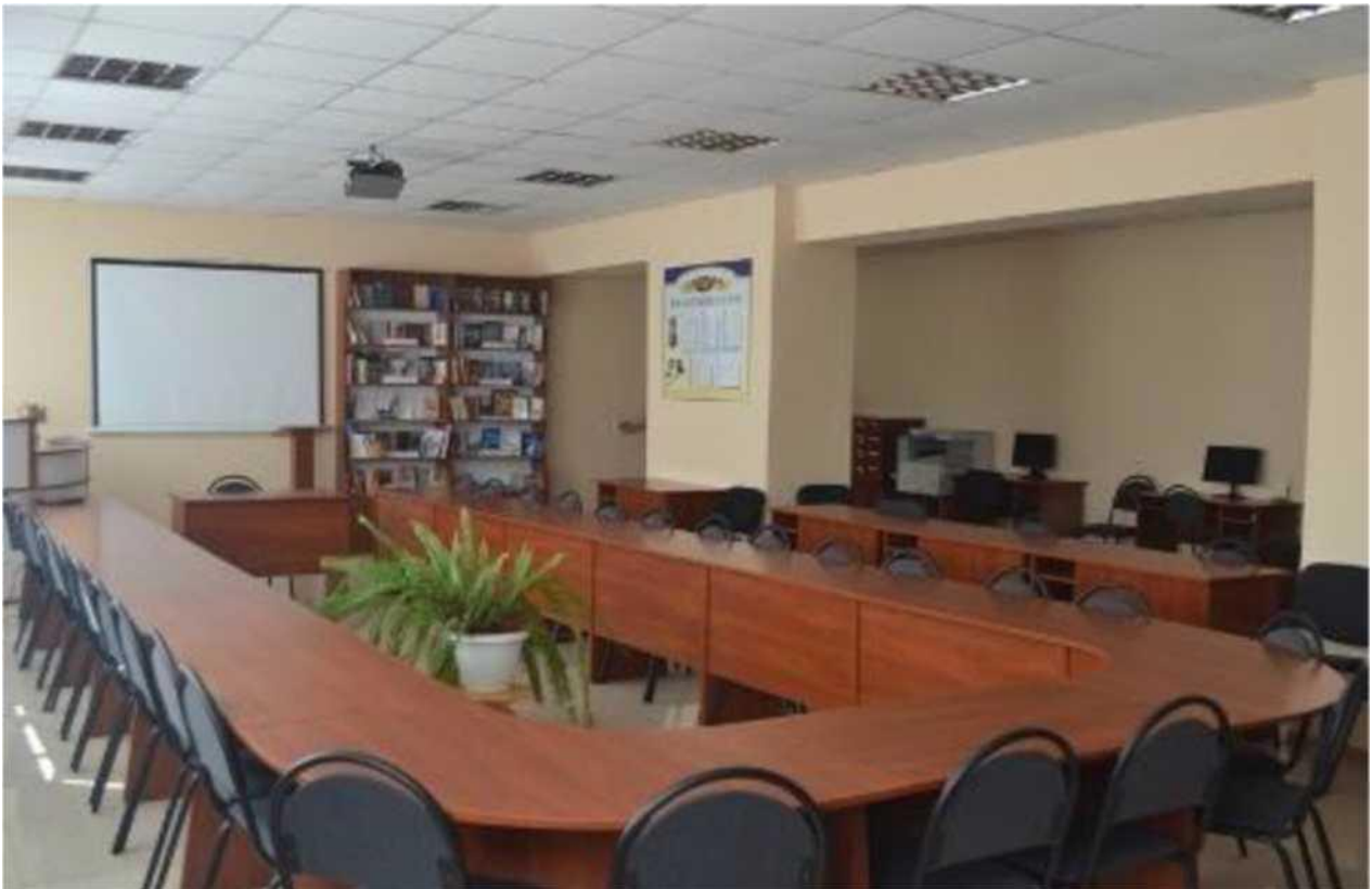
читальний зал бібліотеки