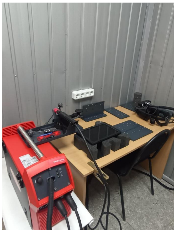
майстерня електрогазозварювальна, лабораторія обладнання електричного зварювання плавленням