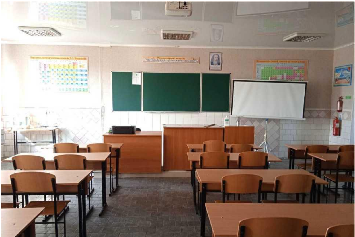
кабінет хімії, основ екології та безпеки товарів народного споживання