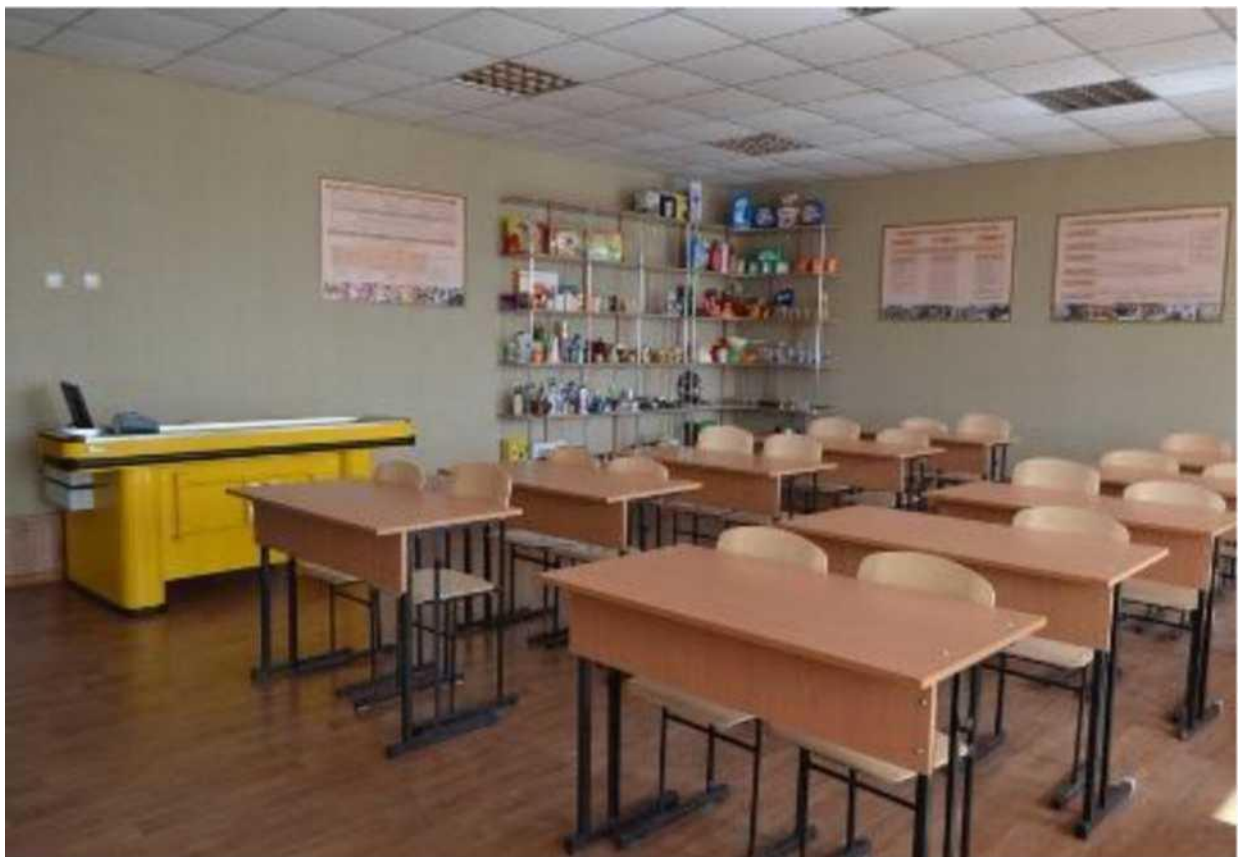
кабінет професійно-теоретичної підготовки з професії "Продавець непродовольчих товарів"