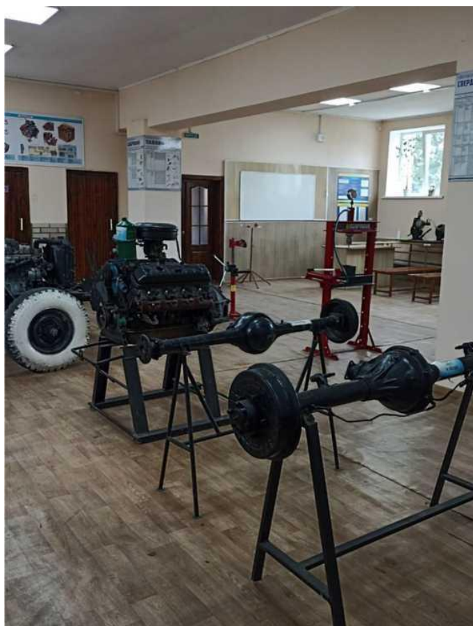
мастерня слюсарна, лабораторія технічного обслуговування колісних транспортних засобів