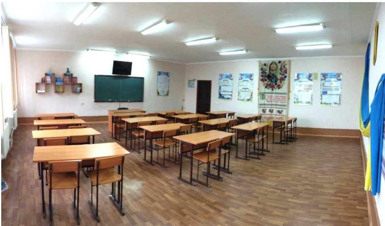
кабінет української мови та літератури, української мови за професійним спрямуванням