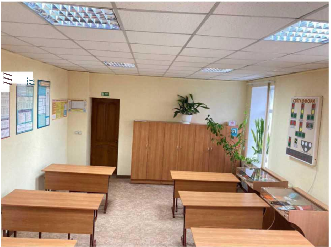
кабінет охорони праці