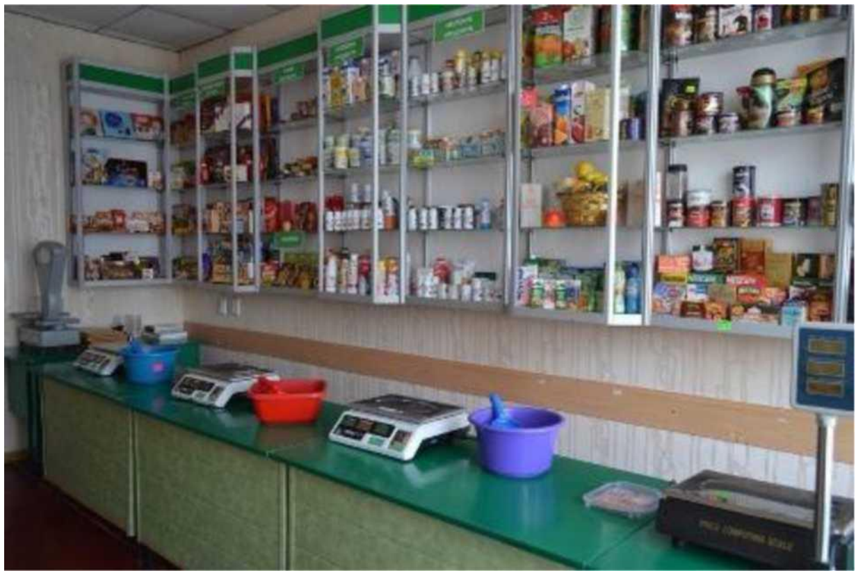
кабінет-лабораторія з професійно-теоретичної підготовки з професії "Продавець продовольчих товарів"