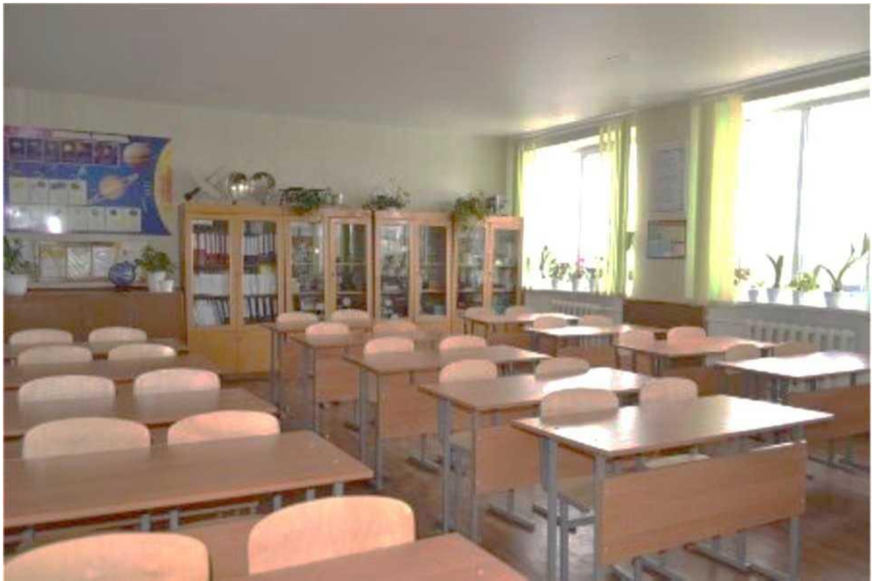
кабінет фізики і астрономії, лабораторія радіоелектроніки та радіовимірювань