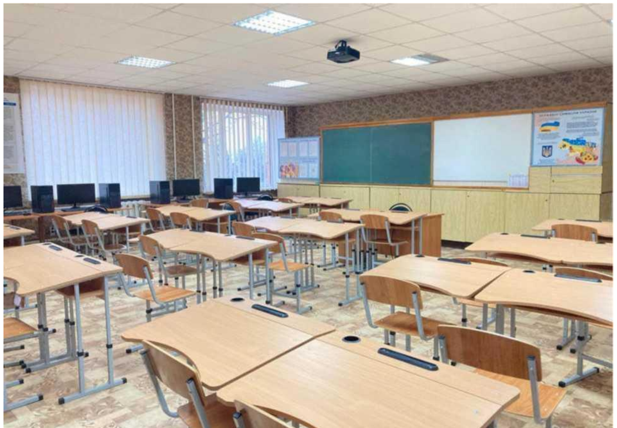
кабінет професійно-теоретичної підготовки з професій «Муляр», «Штукатур», «Лицювальник-плиточник»