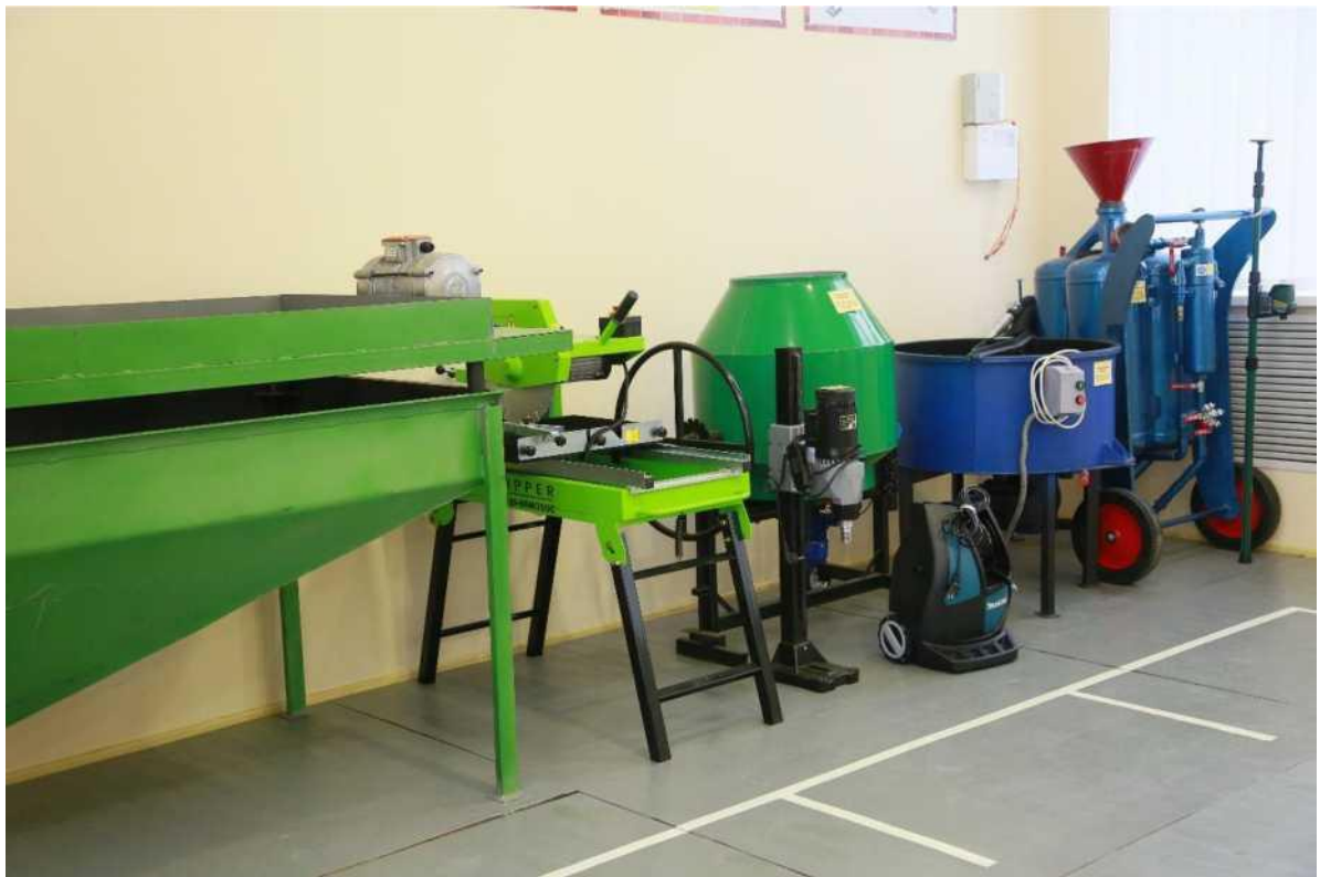
майстерня кам'яних робіт, лабораторія будівельних матеріалів