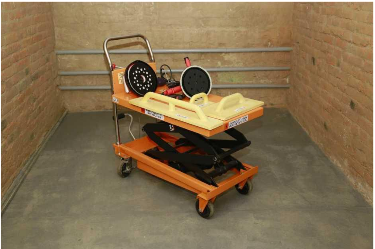
мастерня опоряджувальних робіт, лабораторія будівельних матеріалів