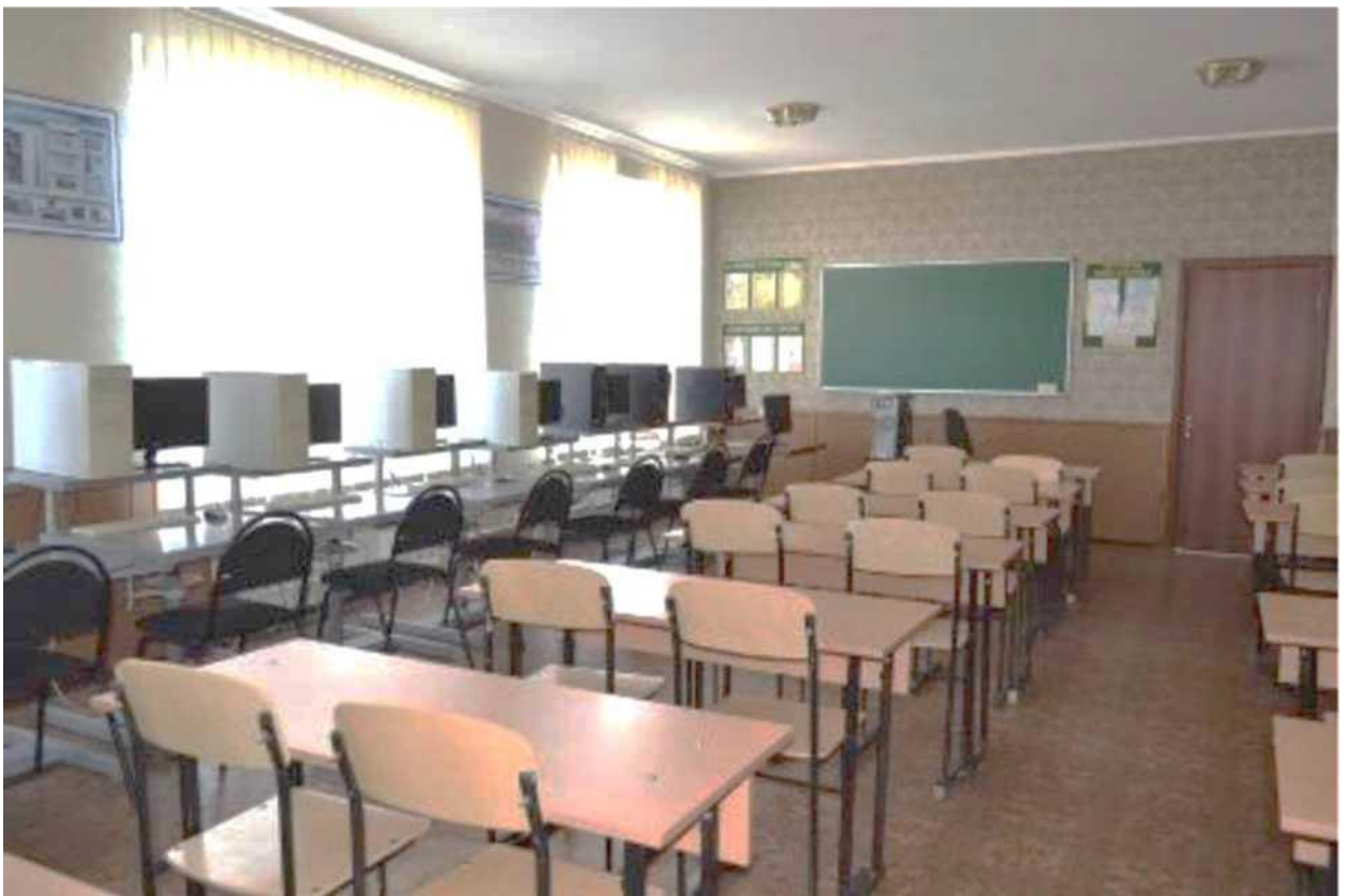
кабінет теоретичної підготовки за напрямом «Будівництво»