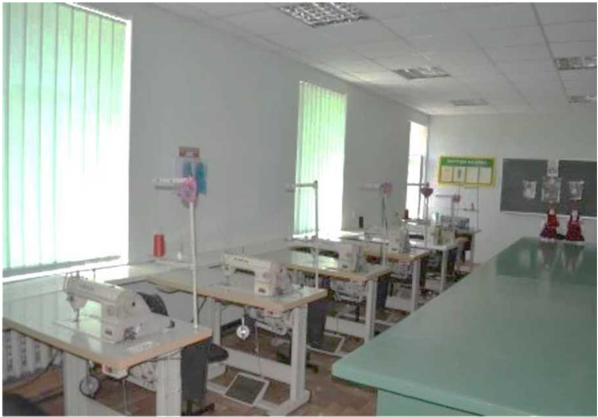
швейна майстерня, лабораторія конструювання швейних виробів