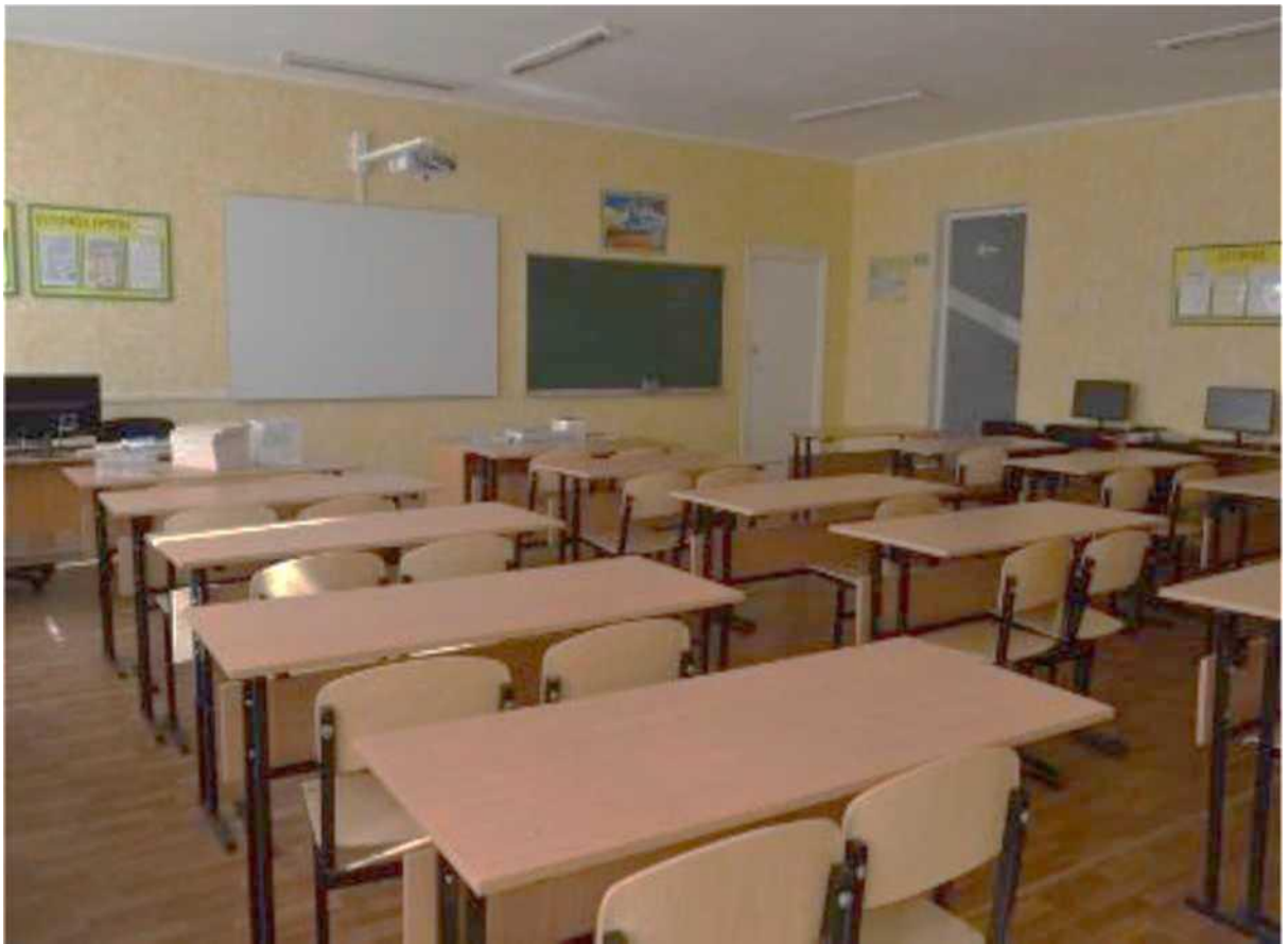
кабінет інформаційних технологій, програмного забезпечення, лабораторія інформаційних технологій