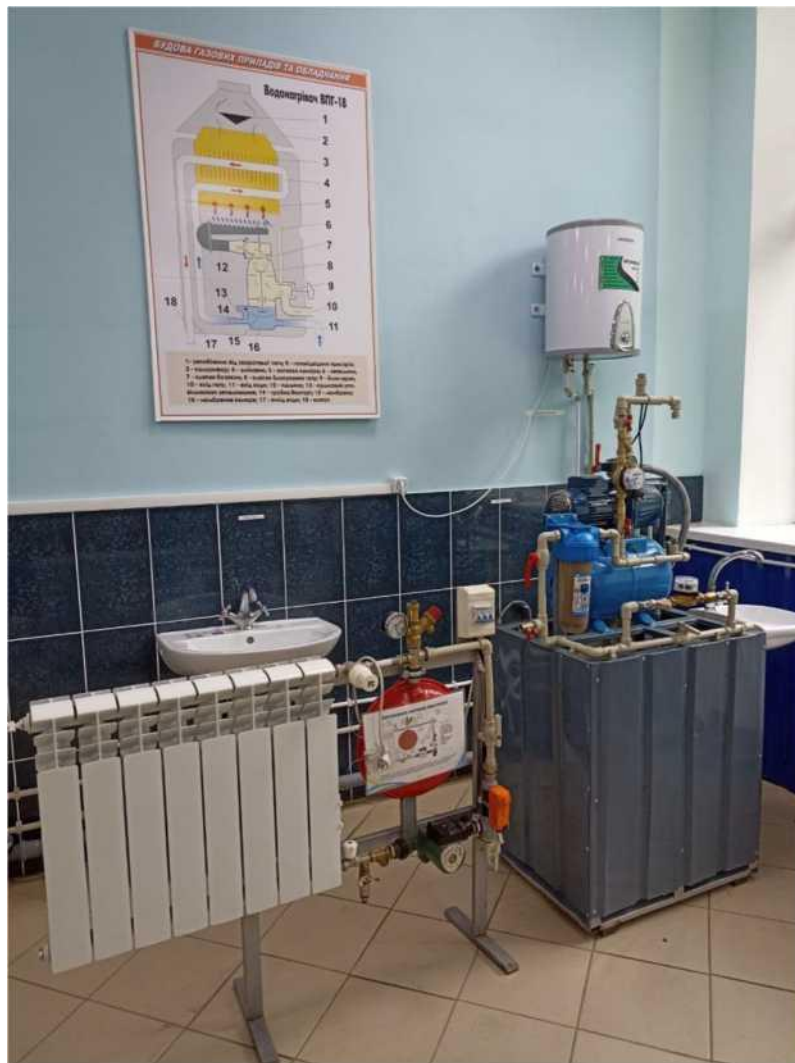
мастерня монтажників санітарно-технічних систем і устаткування