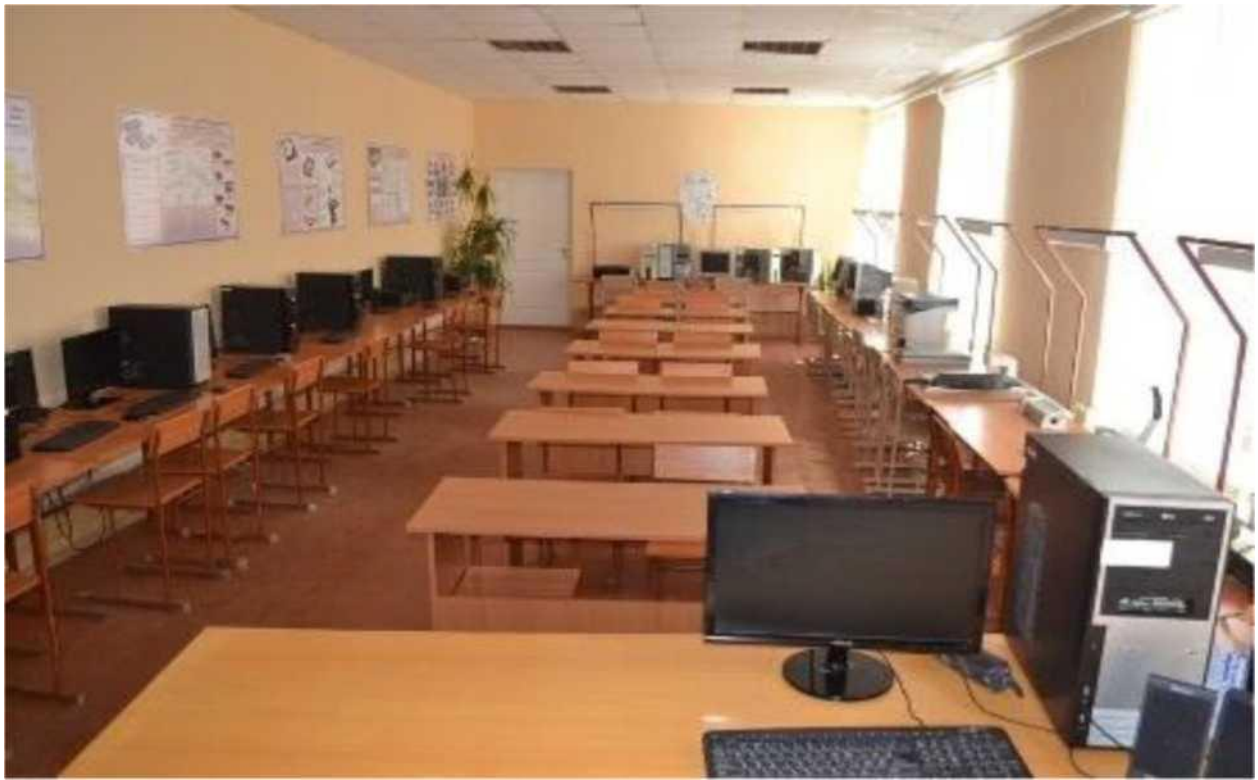
майстерня з ремонту та обслуговування лічильно -обчислювальних машин, лабораторія програмного забезпечення