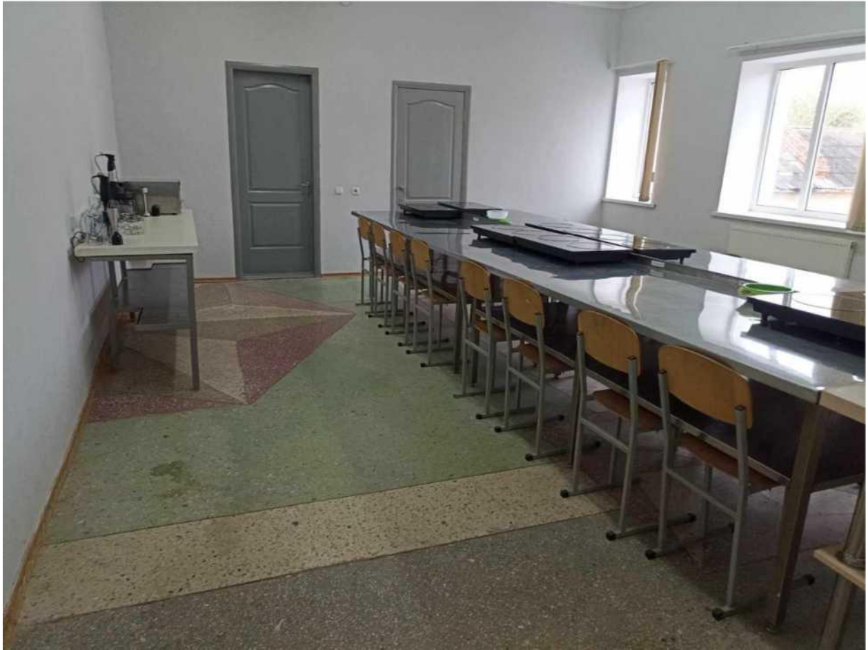
кухня-лабораторія з дегустаційною залом з професії "кухар "