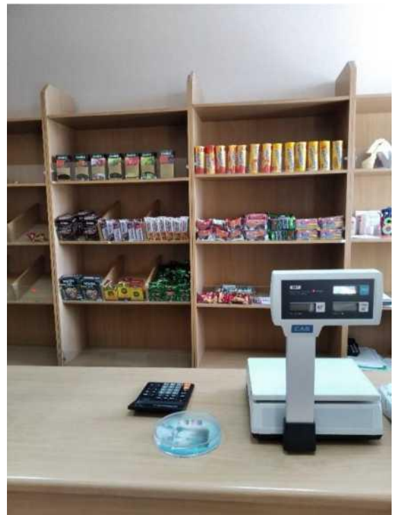
лабораторія - навчальний магазин