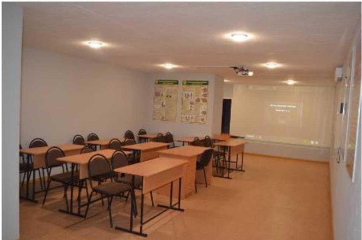
кабінет медико-санітарної підготовки