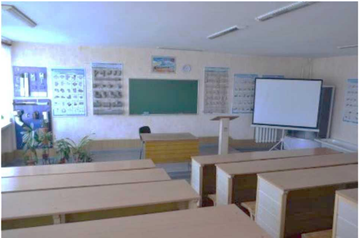
кабінет професійно-теоретичної підготовки з професії "Монтажник санітарно-технічних систем і устаткування"