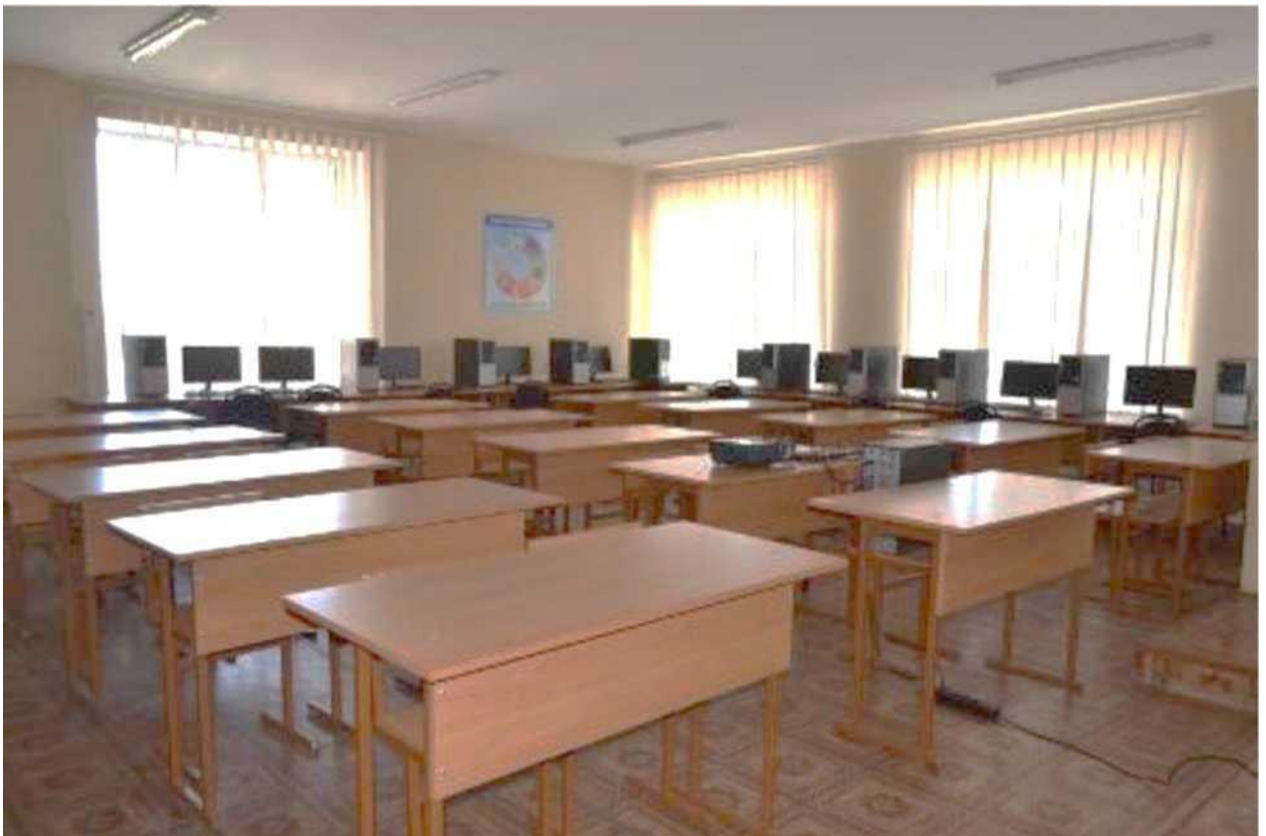
кабінет технології ремонту та обслуговування ЛОМ, експлуатації ПК